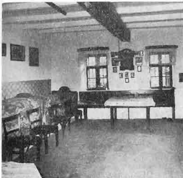
Interiér izby v Tótkomlósi, Maďarsko.