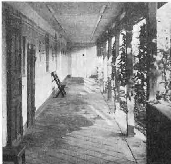
Pohľad na „gang“ v obytnom dome v Tótkomlósi, Maďarsko.