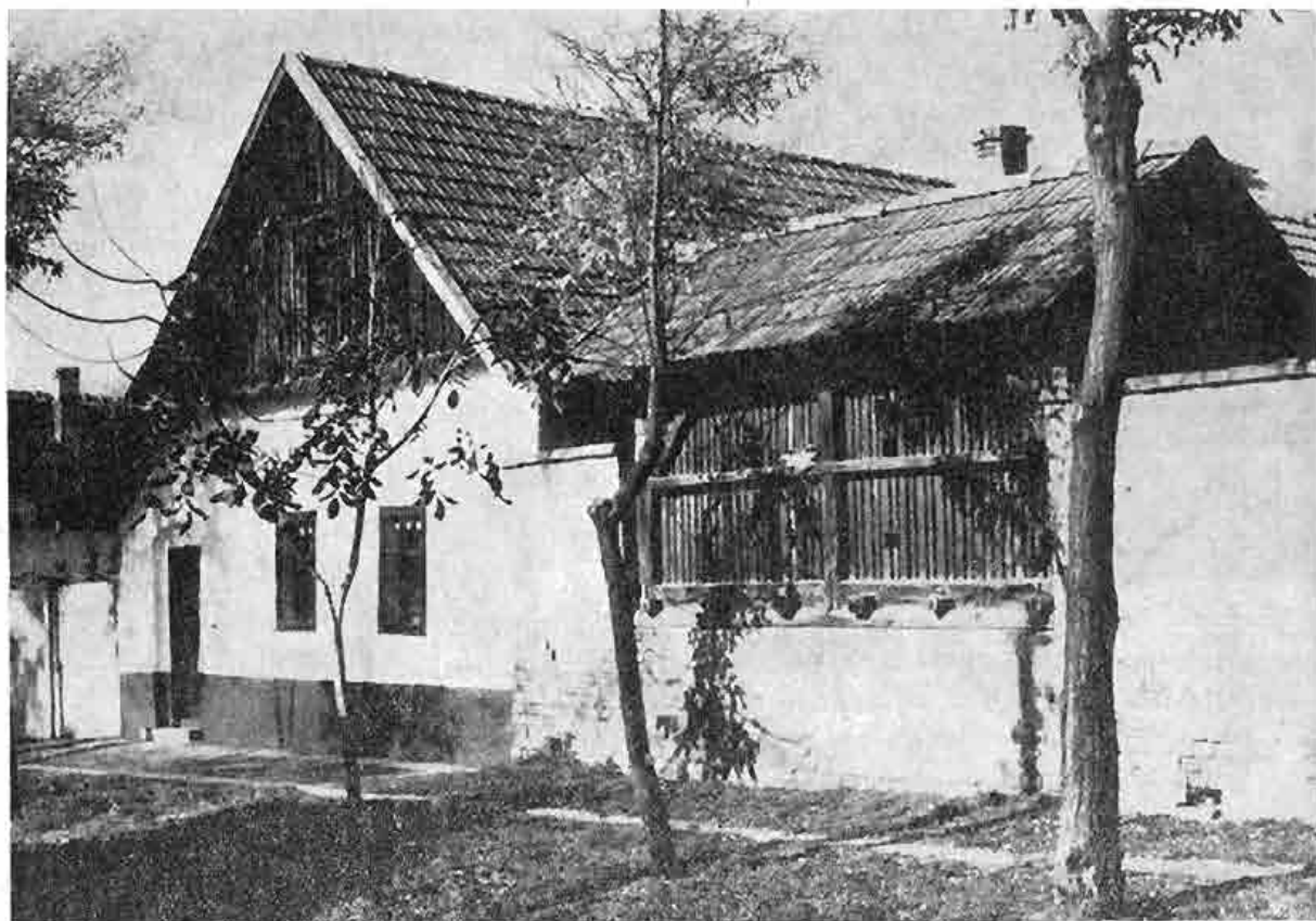
Obytný dom s prístavanou „kotárkou“ na sušenie kukurice v Tótkomlóši, Maďarsko. Foto J. Botík, 1973

pre výskum enkláv pochádzajúcich z územia Slovenska založenej touto koordinačnou radou. 32 Vďaka členom a spolupracovníkom tejto komisie sa problematika štúdia národopisu zahraničných Slovákov dostala vo výsledkoch ich práce aj do zborníka Národopisného ústavu SAV, venovaného zjazdu slavistov v Prahe, 33 ako aj na rokovanie Konferencie etnografov slovanských krajín r. 1970 na Orave. 34