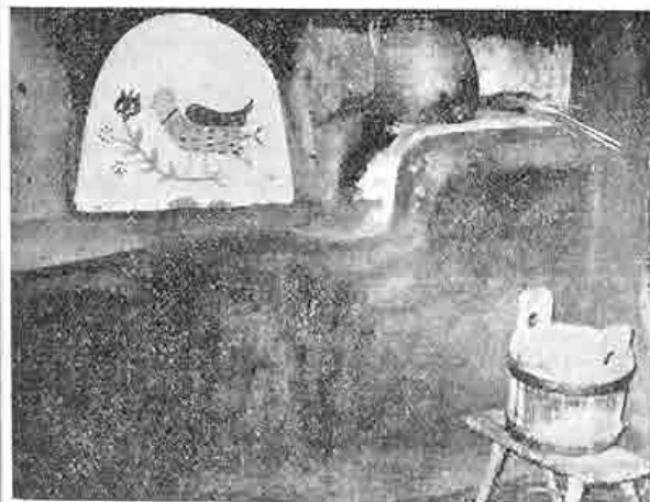
Detail kúreniska umiestneného pod otvoreným komínom v pitvore, Tótkomlóš, Maďarsko. Foto J. Botík, 1973