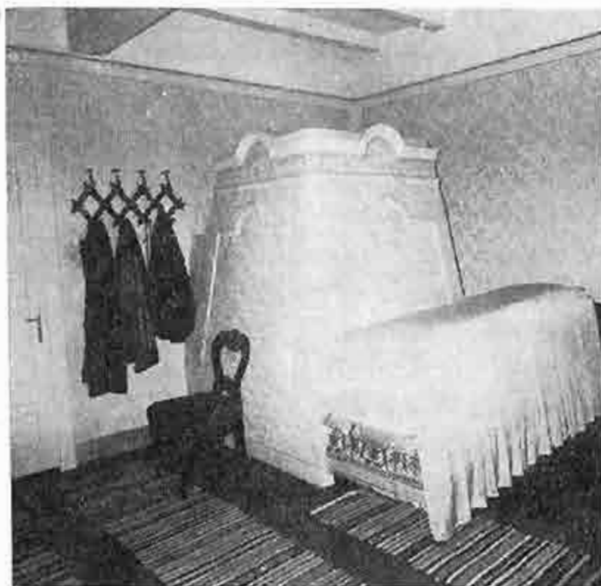
Interiér izby ľudového domu v Tótkomlósi, Maďarsko. 1973