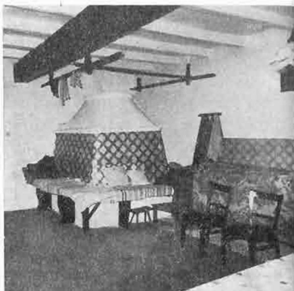
Časť izby s pecou a zariadením, Tótkomlós. Foto J. Botík, 1973

dakcie Slovenského národopisu, že od tohto obdobia až po súčasnosť kontinuálne publikuje články, správy, štúdie z pera dolnozemskej rodákov, Slovákov žijúcich v ČSSR, ale aj štúdie a články zahraničných vedcov o problematike národopisného štúdia slovenských enkláv v ich krajinách. 12