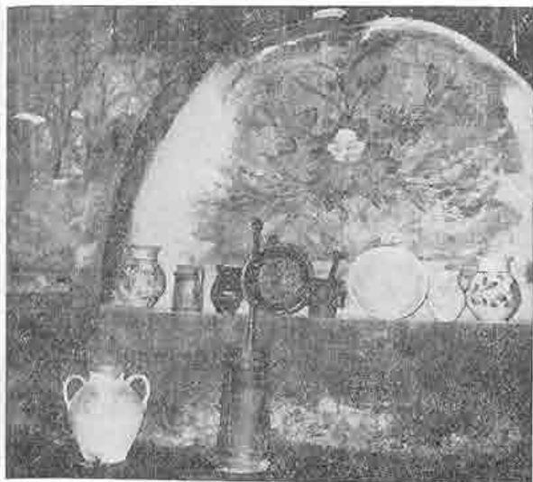
Maľovaná stena v pitvore pod otvoreným komínom v Tótkomlóši, Maďarsko. Foto J. Botík, 1973